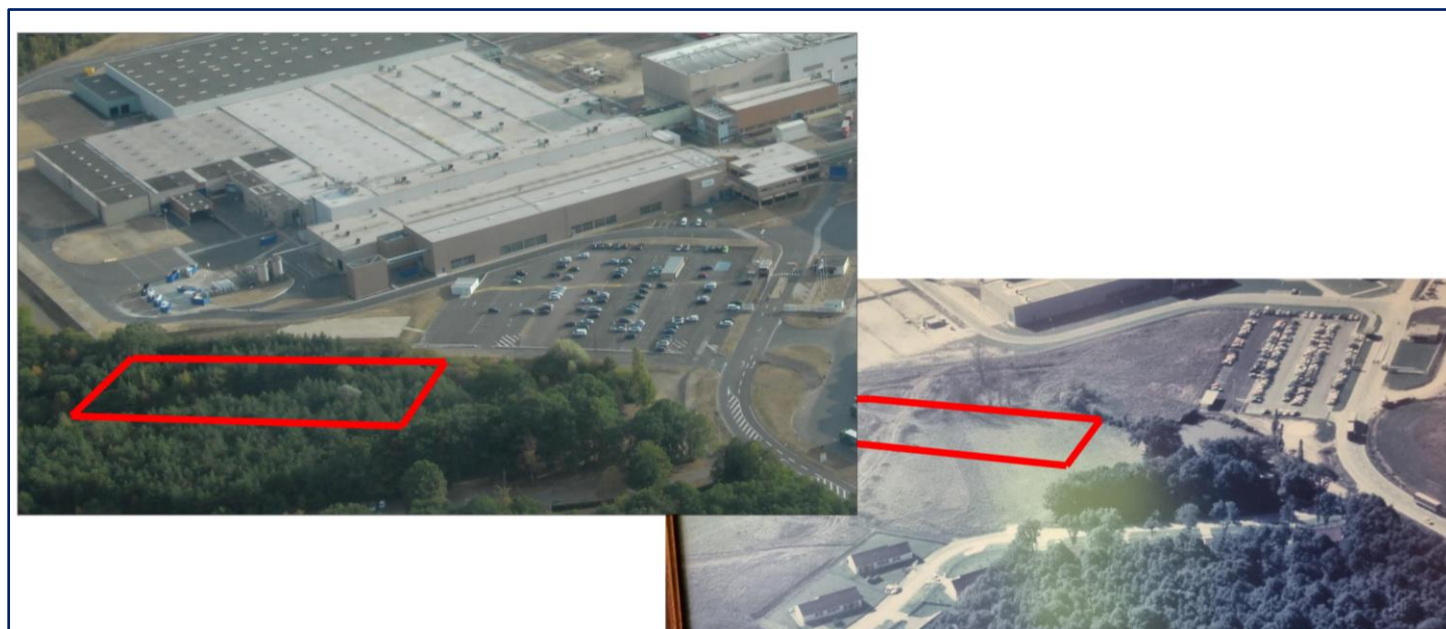
Années 1990 - 2000